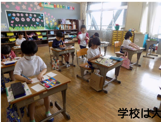
学校は大切な学びの場